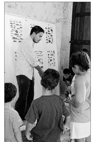
Algunes de les activitats realitzades aquest estiu entre els nins per promoure la creació de la reserva marina. A d'alt el concurs de caça fotogràfica en apnea i a baix un moment de Conèixer els nostres fons.

El Club Nàutic té paraules d'agraïment per a «totes les institucions i col·laboradors que han fet possible aquestes activitats però recorden que el seu objectiu principal és «conscienciar, mostrar i potenciar la proposta de la reserva marina, que creiem que és molt necessària per a tots els sollerics. Solivellas recorda que a la pàgina web del club hi ha una relació d'activitats, resums de premsa i manifestacions sobre la reserva, tant dels que en són favorables com dels detractors: «de tots ells esperam les seves aportacions i opinions», assegurarà.