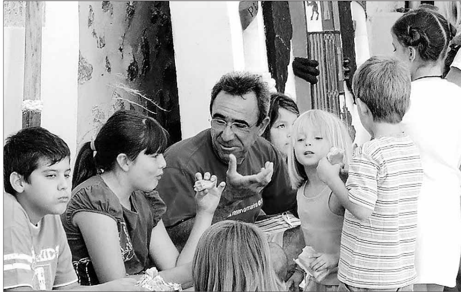
La divulgació dels fons marins ha estat un dels objectius principals del Club Nàutic.

Solivellas assegura que «tampoc tenim noves de la Conselleria d'Agricultura i Pesca, ja que no han contactat amb nosaltres encara que sigui per informar-